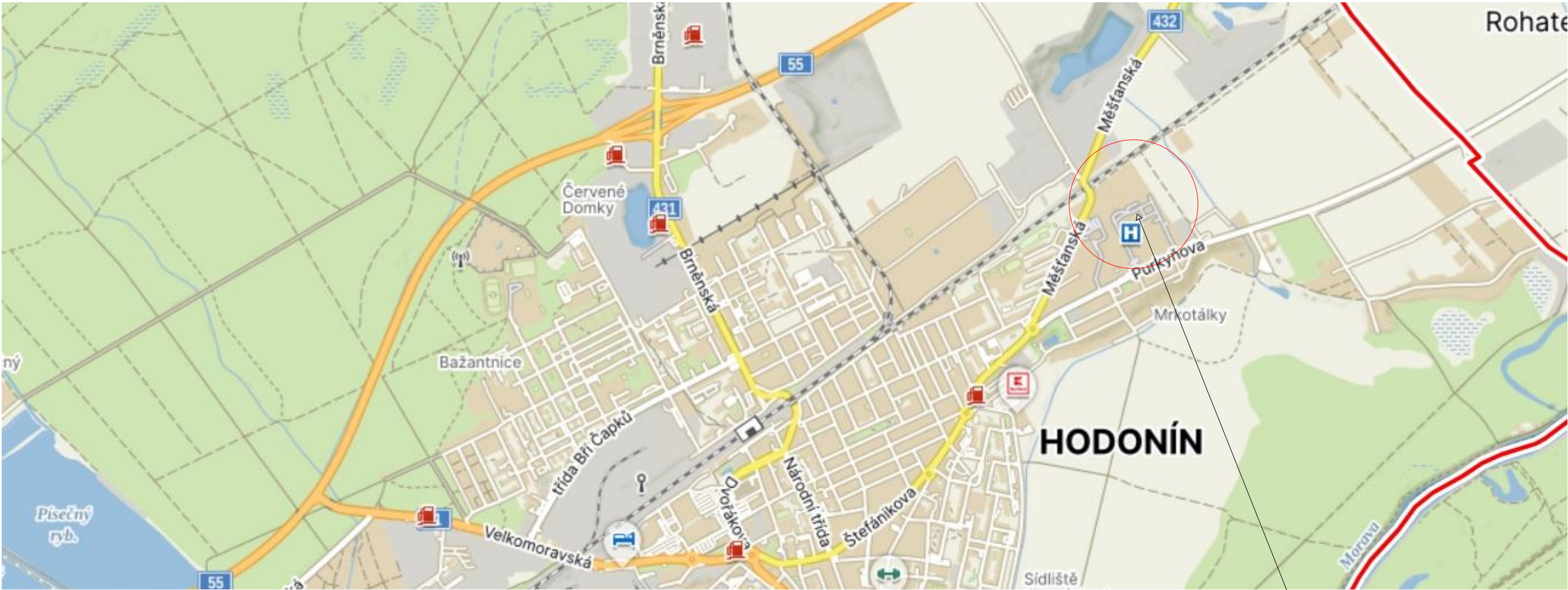
SITUACE ŠIRŠÍ VZTAHY.