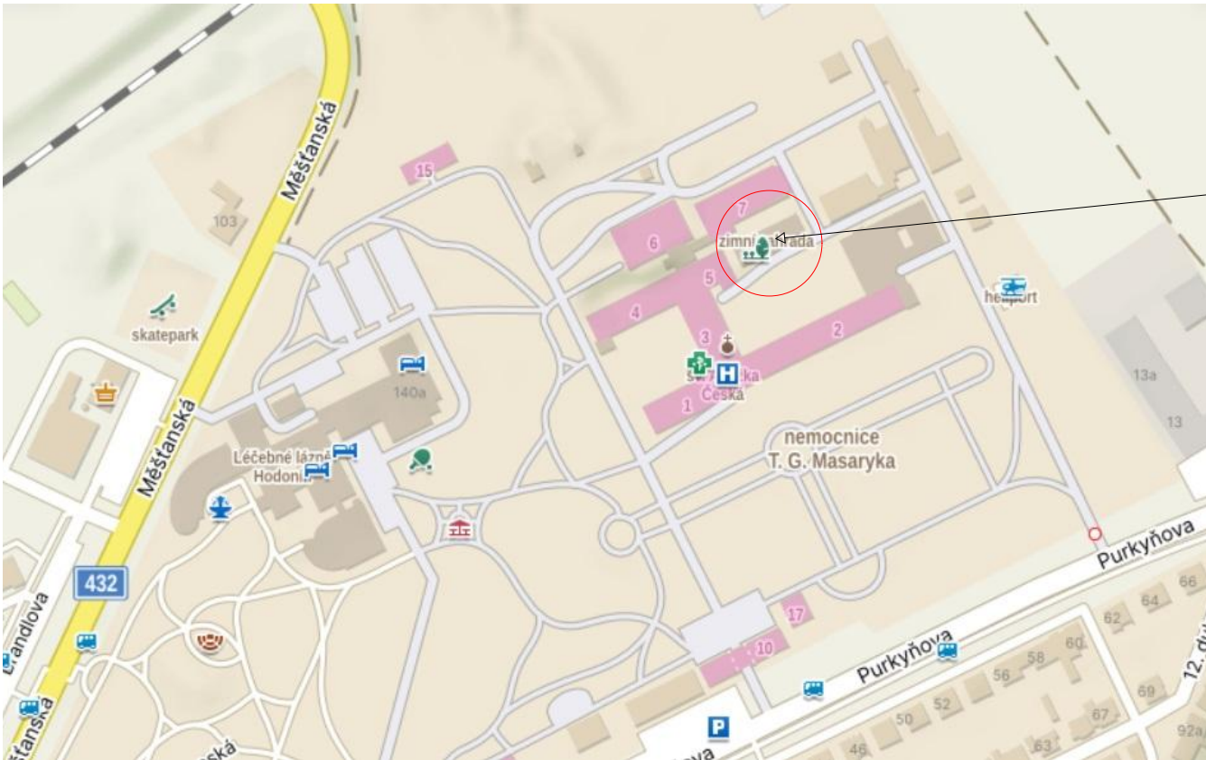
1 - ZÁJMOVÉ ÚZEMÍ